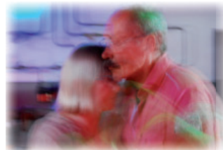
Impressionen vom Tango im Kesselhaus in Landau