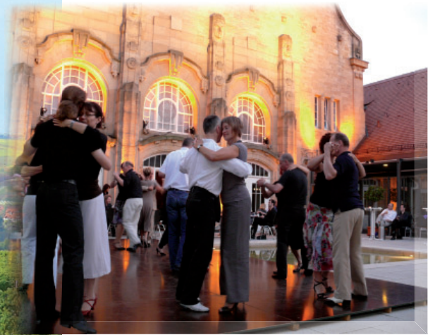
Tango Open Air im Konzertgarten der Jugendstilfesthalle Landau

Im ganz besonderen Ambiente des denkmalgeschützten Kesselhauses findet seit Juni 2011 an jedem dritten Sonntag im Monat eine Milonga statt, auf welcher vorwiegend